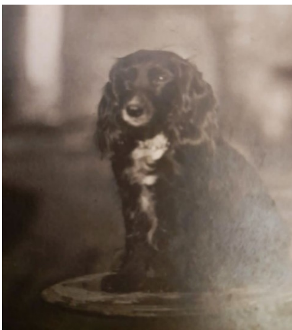
Рис. 17. Спаниель Маб, заводчик Н. Ф. Вальдман. Фото 34