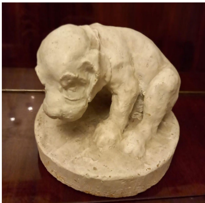
Рис. 15. Н. Ф. Вальдман. Гипсовая статуэтка маленькой Маб. Фото 31

Всю жизнь Николай Фридрихович был предан одной породе собак — спаниелям (рис. 15). Какое место они занимали в его жизни, можно судить по его экслибрису — владельческому книжному знаку, который создала для него ленинградский график, театральный художник Визель Татьяна Эмильевна (1904–1976) из известной художественной династии Визелей (рис. 16). Изображение для такого печатного знака всегда символично и наполнено разнообразной информацией о владельце, призванной в художественных образах передать его профессиональную принадлежность, отразить его личность, характер и интересы. И всё это необходимо уместить в рамки небольшого эскиза для изготовления штампа. Концептуальная картина мира Николая Фридриховича Вальдмана в экслибрисе представлена тремя фигурами, вписанными в треугольник. В его основание помещены спиной к зрителю изображения маленького мальчика и черного спаниеля, чьи взгляды обращены на обезличенную скульптуру женщины на высоком станке мастера в вершине композиции, сужающейся практически до точки, за которой только книги. Можно трактовать этот рисунок по-разному. Во многих культурах треугольник, обращенный вверх острием, символизирует мужское начало, а в античной традиции — стремление материи к духу. В данном случае прочитывается триединый образ вселенной Вальдмана, сотканый из книжных идиллий и жизненной эмпирики, куда, наряду со скульптурным изображением его жены-музы, сына, включена любимая собака.