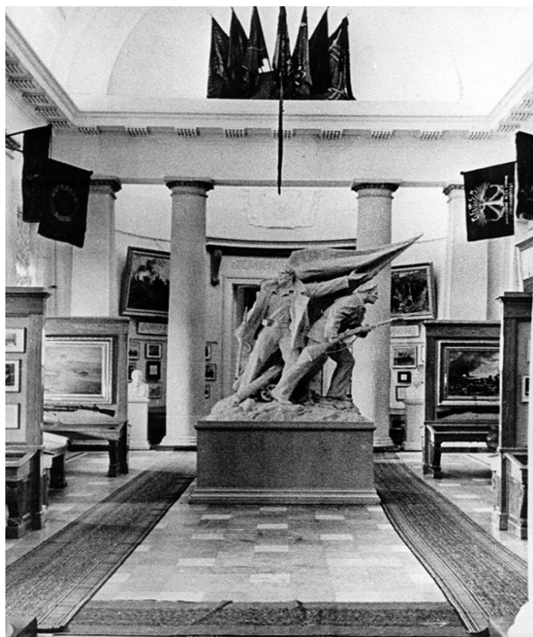
Рис. 13. Один из залов Центрального военно-морского музея, открытый в здании Биржи. 1941 29