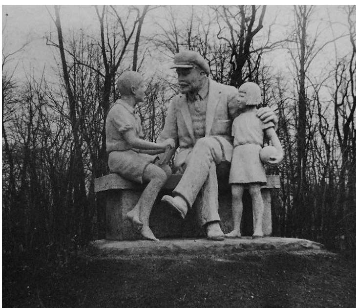
Рис. 10. Л. П. Зиверт. Памятник «Ленин и дети» («Счастливое детство») в Детском саду Дома культуры (б. Михайловский сад). Скульптор Н. Ф. Вальдман. Ленинград. Май 1935 года. Фото 25