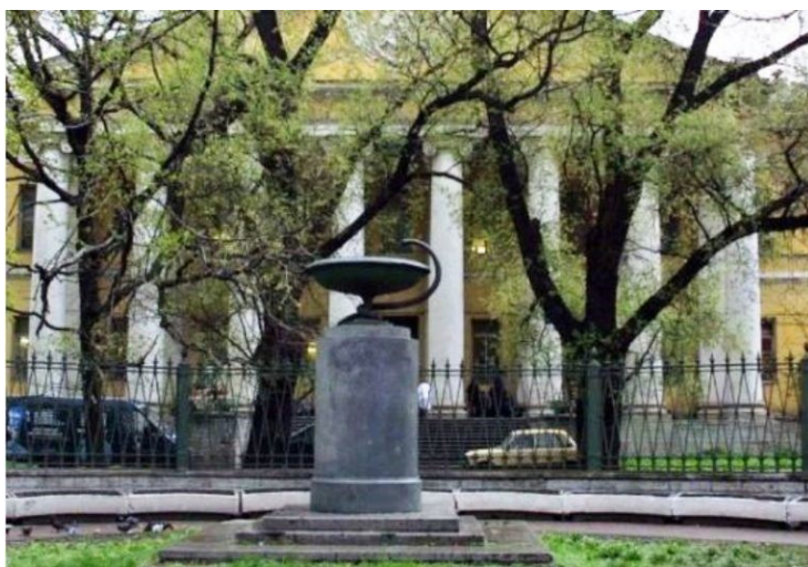
Рис. 8. Н. Ф. Вальдман. Ссосуд Гигеи (Гигиени). Санкт-Петербург. 2000-е годы 23