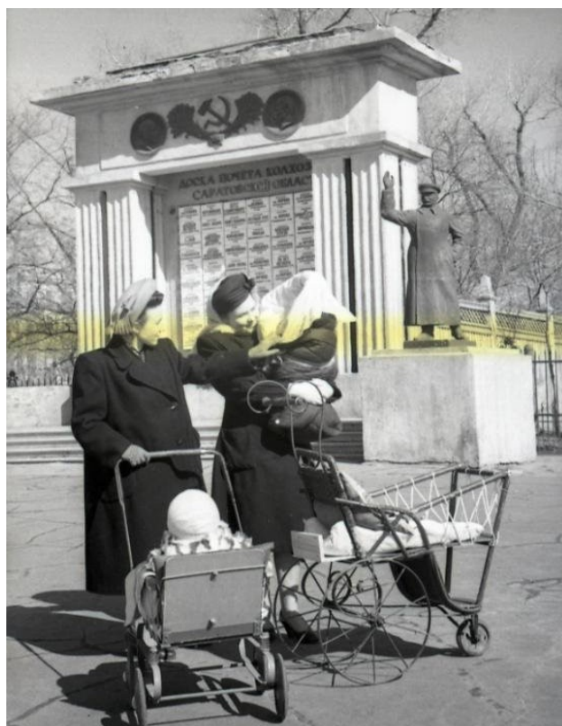
Рис. 12. Молодые мамы на площади им. Чернышевского в Саратове. Весна, 1952 28