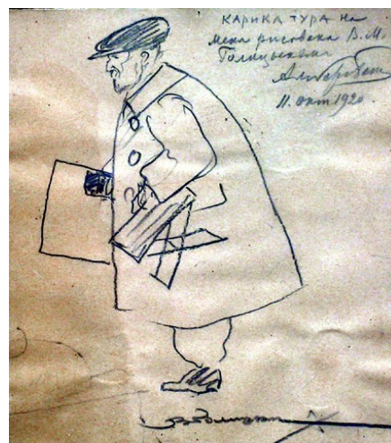
Рис. 4. В. М. Голицын. Карикатура на А. Н. Бенуа. 11 октября 1920 года 7

Также Б. И. Кошечкин заявил о желании получить для демонстрации в экспозиции «пейзаж Н. Ф. Вальдмана “Вид на залив и порт Мурманск” и акварель А. Н. Бенуа с видом Мурманска. Они могли бы быть использованы в экспозиции, посвященной развитию города и порта». Так как ко времени написания письма Кирилл Николаевич еще не определился, кому передать указанные работы (Музею-Архиву или Мурманскому краеведческому музею), Борис Иванович заметил, что «интерес областного краеведческого музея здесь также оправдан» 8 .