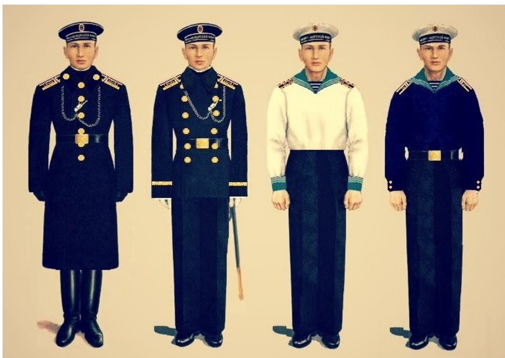
Рис. 5. Черные гардемарины 15

После возвращения и сдачи практических экзаменов весной 1914 года юнкеров разместили для занятий в Крюковских казармах 2-го батальона 2-го Балтийского флота экипаж и переименовали в гардемарины. Их форма не отличалась от той, что была у гардемарин МКК, но погоны были черные, поэтому они получили прозвище «черные гардемарины» 14 .